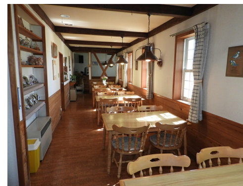
窓から木々の緑を眺めながらお食事を