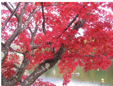
自然豊かな標高1750mにあり 辺りの穏やかな雰囲気そのままに佇み 夏は涼しく快適 四季を通して楽しめる北八ヶ岳 楽しい山とのふれあいのお手伝いを させていただきます