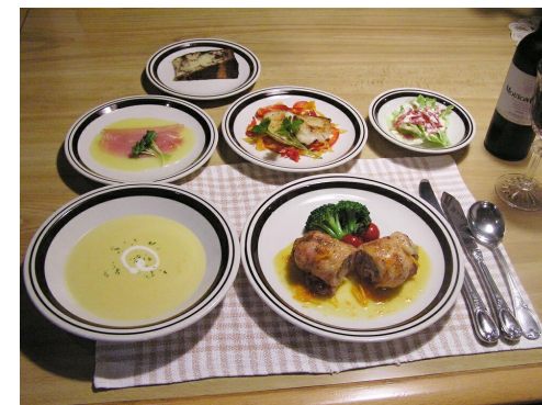
食事は旬の食材を盛り込んだ洋風コース料理です